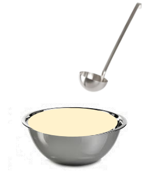
ממלאים מצקת מהקערה