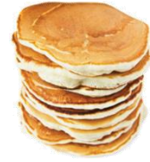
מוציאים את הפנקייק מהמחבת