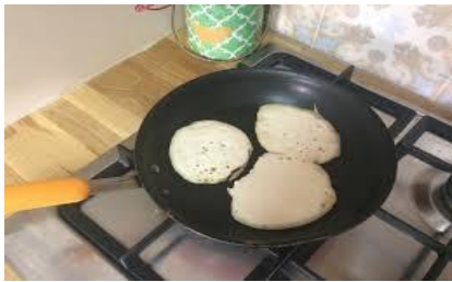
ממלאים עוד מצקת מהקערה