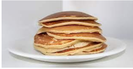
שמים על צלחת